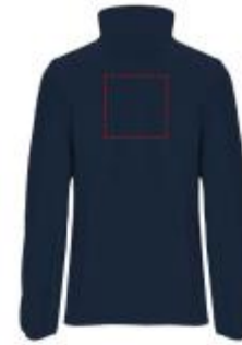
Großflächig auf die Rückseite

• Screenprint B Textile 2 (2c) , max. 150x150mm