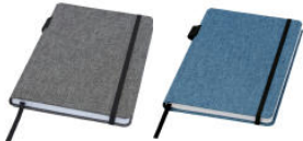
Heather Grau Hale Blau