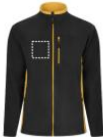
SoftShell jacke - Linke Seite