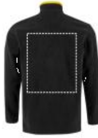
SoftShell jacke - Rückseite