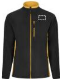
SoftShell jacke - Seitlich oben